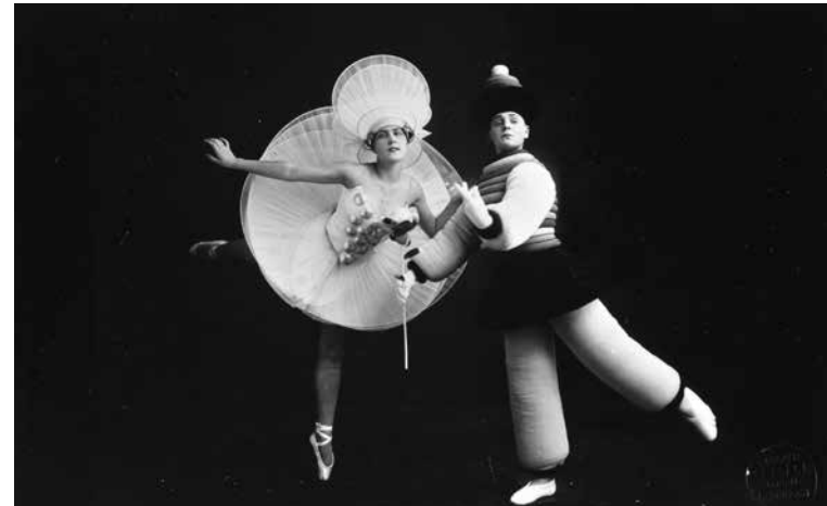
Das „Triadische Ballett“ von Oskar Schlemmer und Paul Hindemith war ein Höhepunkt der Donaueschinger Kammermusiktage 1926

Wer nach Orten fragt, die für die Musikentwicklung des 20. Jahrhunderts bedeutsam waren und sind, wird rasch auf den Namen Donaueschingen stoßen - der Ort, den schon Thomas Mann als Zentrum Neuer Musik literarisch verewigt hat. Die 1921 unter fürstlicher Protektion neu gegründeten Donaueschinger Musiktage existierten fünf Jahre lang als Zentrum zeitgenössischer Kammermusik – mit Paul Hindemith als prägender Figur, aber auch mit Uraufführungen von Berg, Schönberg und Webern. 1950 gelang ein adäquater Neubeginn in Zusammenarbeit mit dem Südwestfunk, der sein Orchester zur Verfügung stellte und damit einen neuen Programmschwerpunkt einbrachte. So konnten wichtige Orchesterwerke nicht nur der klassischen Moderne, sondern auch von jüngeren Komponisten bekannt gemacht werden: Von Pierre Boulez, Karlheinz Stockhausen, Luigi Nono und Iannis Xenakis waren in den fünfziger Jahren skandalumwitterte Uraufführungen instrumentaler Werke zu hören. Danach setzten Krzysztof Penderecki und György Ligeti, später auch Wolfgang Rihm, in Orchester-Uraufführungen neue Akzente.