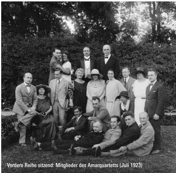
Vordere Reihe sitzend: Mitglieder des Amarquartetts (Juli 1923)