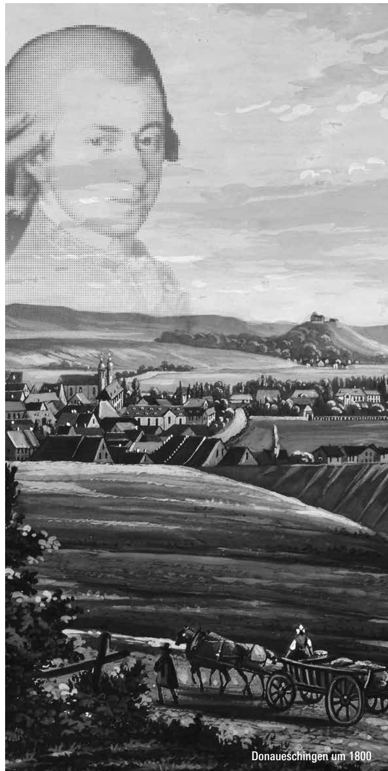
Donaueschtingen um 1800