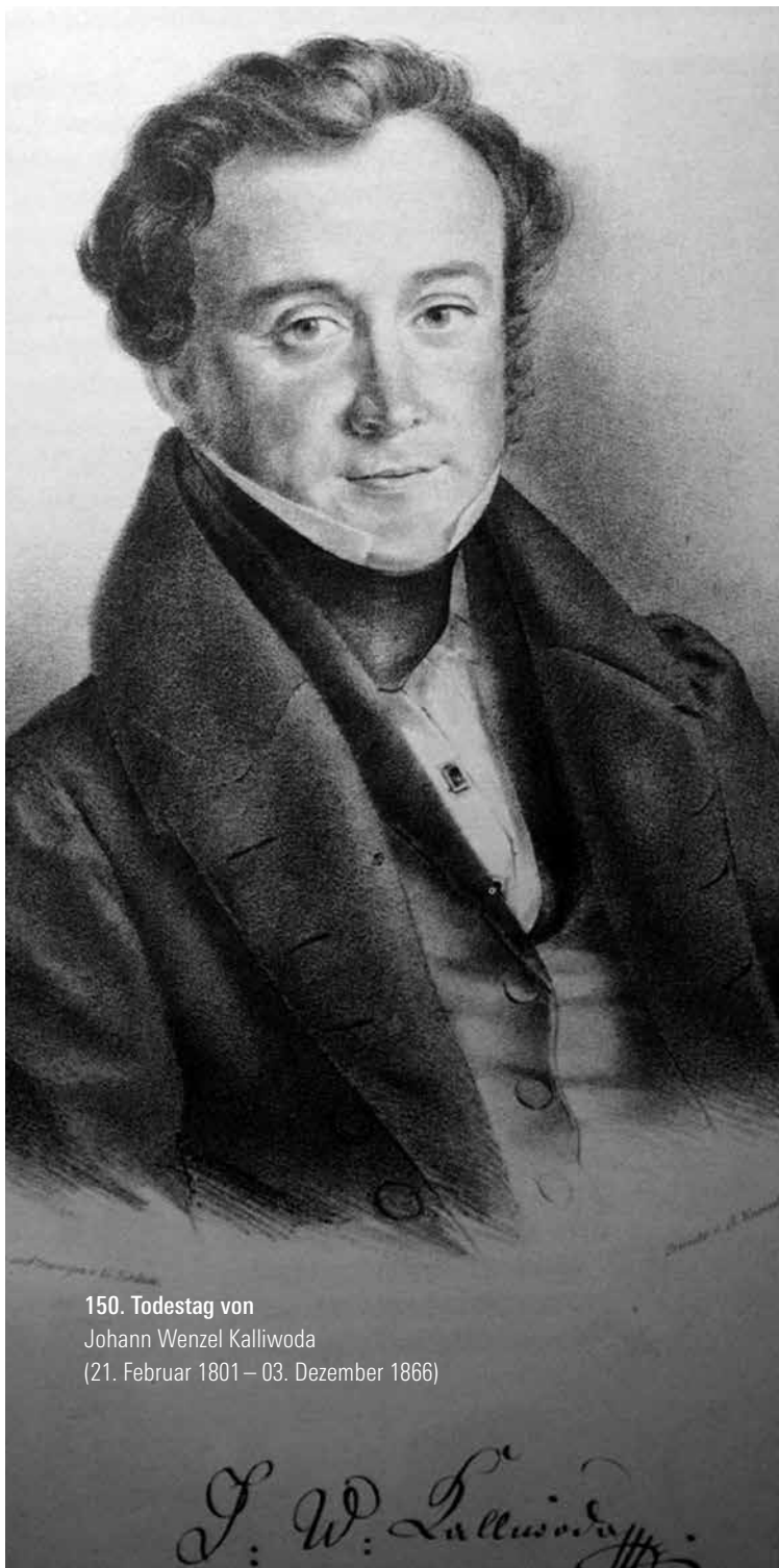
150. Todestag von Johann Wenzel Kalliwoda (21. Februar 1801 – 03. Dezember 1866)